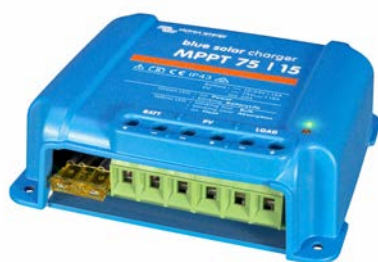
Contrôleur de charge solaire MPPT 75/15