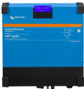
Convertisseur RS Smart 48/6000